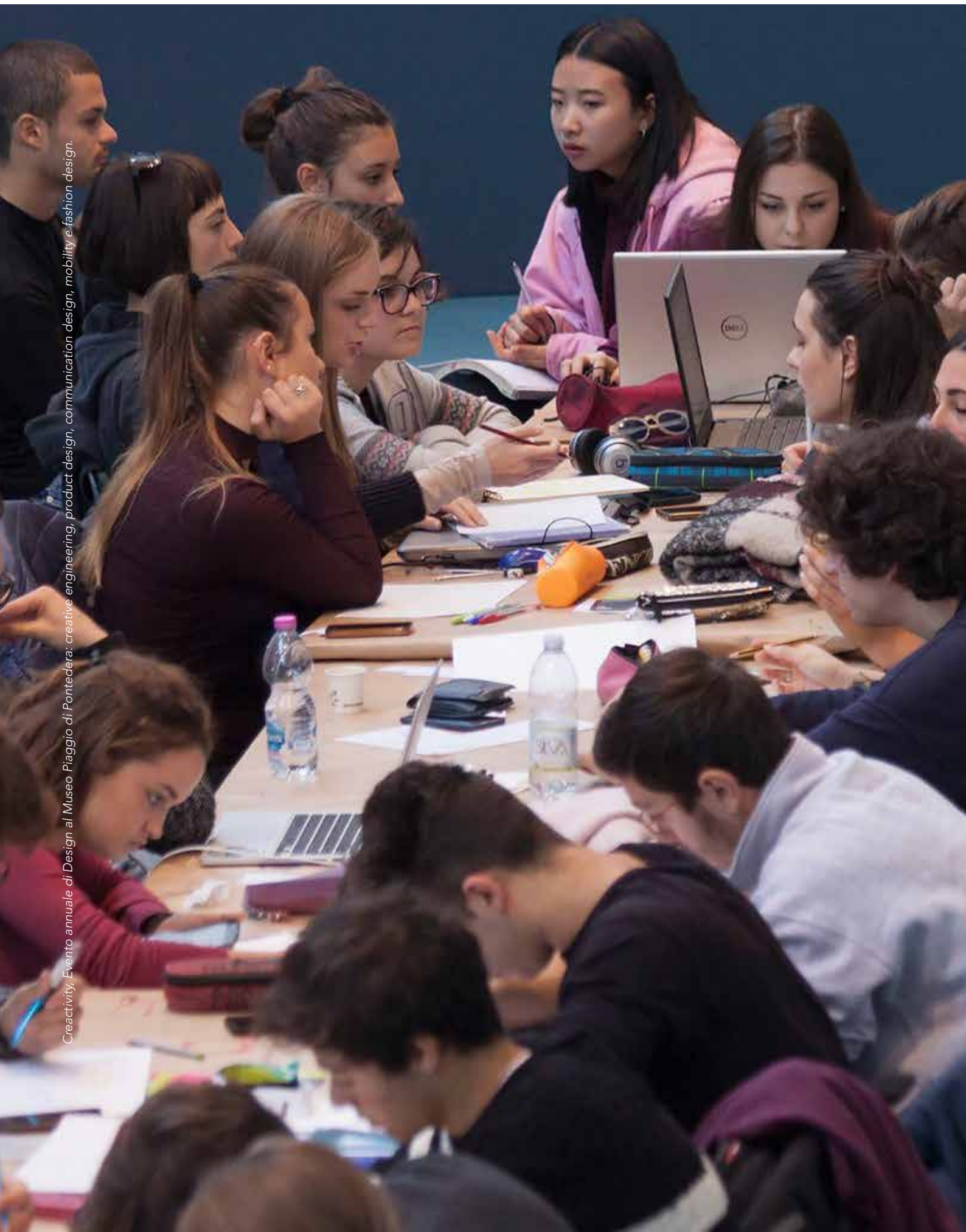
Creativity. Evento annuale di Design al Museo Piaggio di Pontedera: creative engineering, product design, communication design, mobility e fashion design.