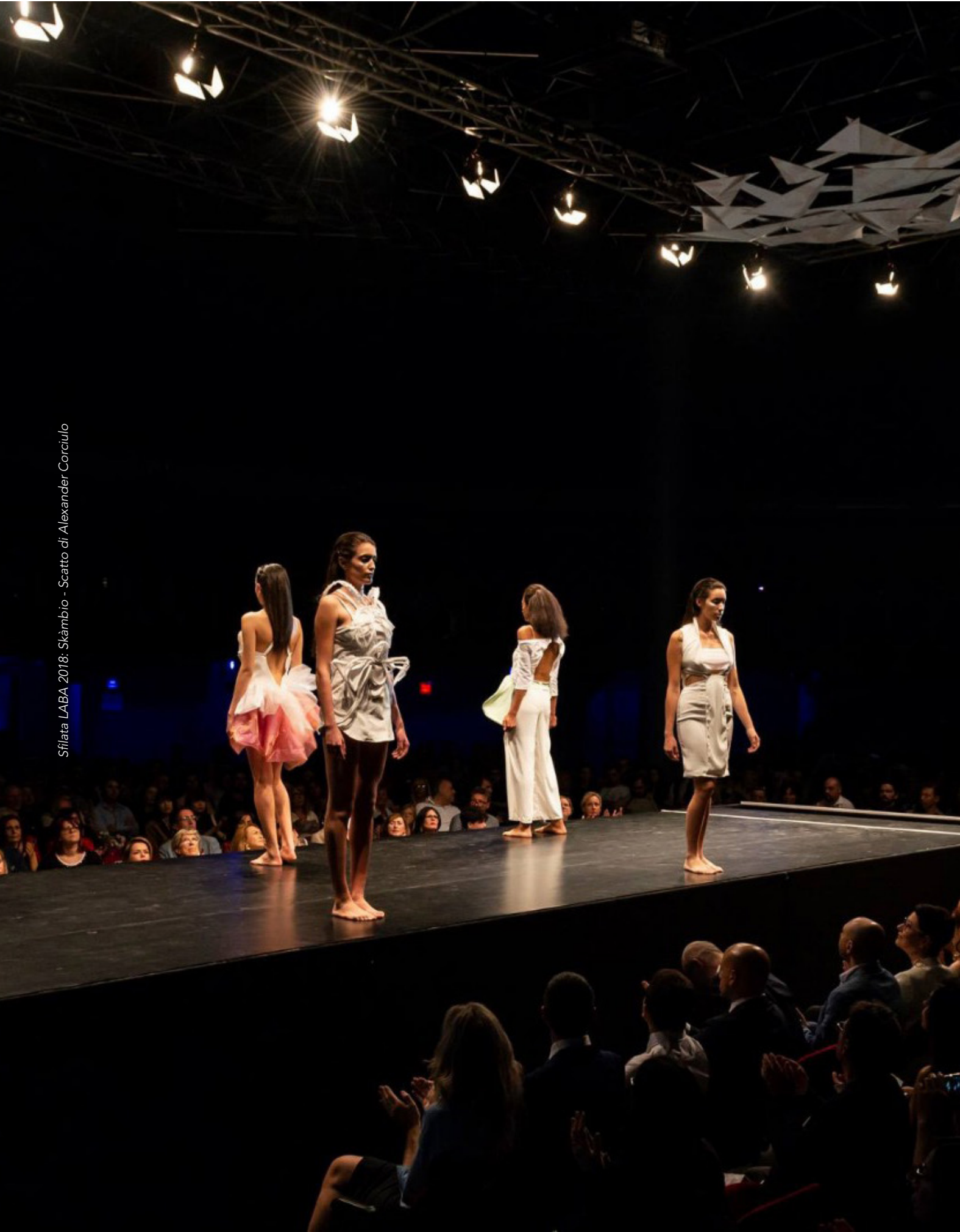
Sfilata LABA 2018: Skambio - Scatto di Alexander Corciulo